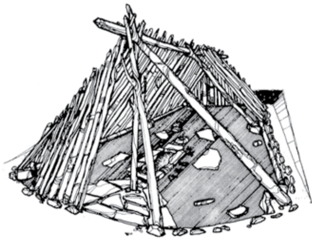
Lepenski Viri ehitise rekonstruktsioon.