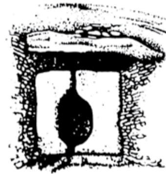
Glouchestershire kääbaste sissekäik.